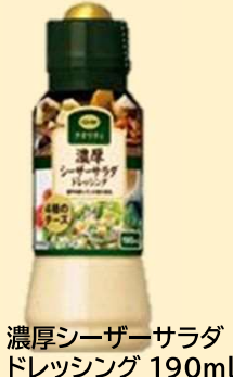
濃厚シーザーサラダドレッシング 190ml