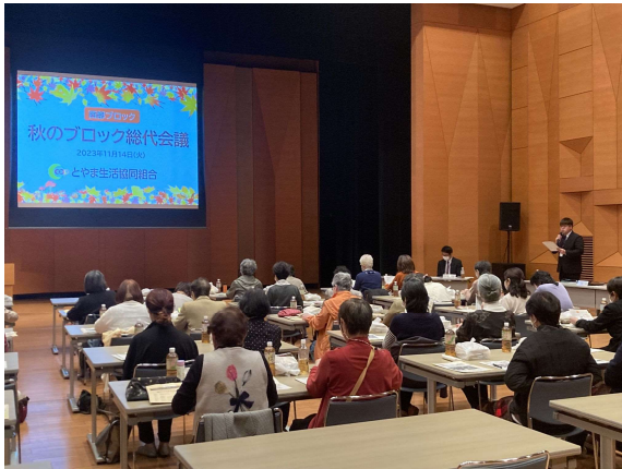
昨年度の秋のブロック総代会議の様子

ぜひご都合を合わせてご出席いただきますよう、よろしくお願いいたします。 (開催案内と出欠連絡票は、この運営通信と一緒にお届けしております。)