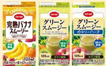
完熟バナナスムージー(食物繊維) 125ml グリーンスムージー(1食分の野菜) 125ml グリーンスムージー カロリーハーフ (1食分の野菜) 125ml