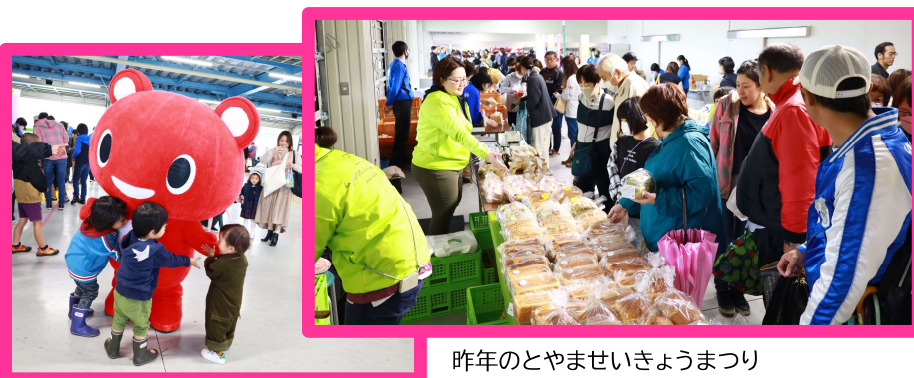
昨年のとやませいきょうまつり