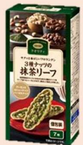
3種ナッツの抹茶リーフ 7枚

票の多かった方のセットを当日サンプルとしてお渡しします！投票よろしくお願ひします。