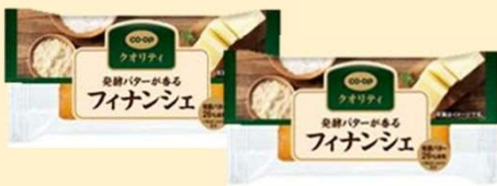
発酵バターが香るフィナンシエ 2個