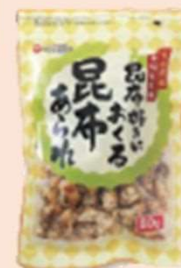
昆布好きにおくる昆布あられ(80g)