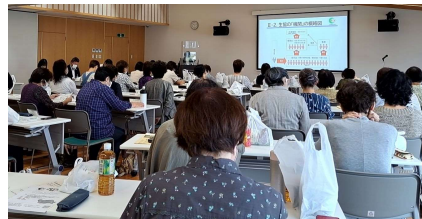
【総代の役割学習】 組合員活動報告

※開催のご案内は、9月上旬に総代当選通知と同封してお届けしております。出欠のご連絡がまだの方は、下記までご連絡をお願いします。