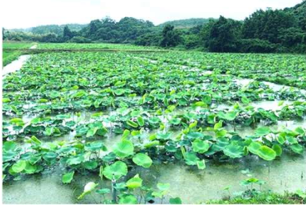
レンコン畑の様子 (福田農園ホームページより画像引用)