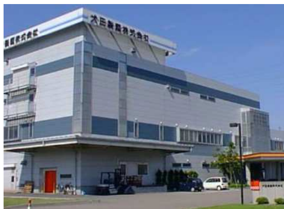
本社（高岡市戸出春日）