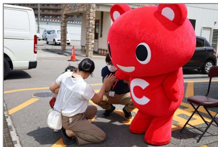
▲コーすけもお祝いに駆けつけてくれました！