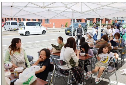
▲豚汁・おにぎり美味しいね！