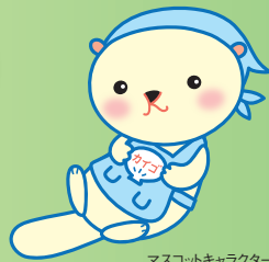
マスコットキャラクター「かいこん」